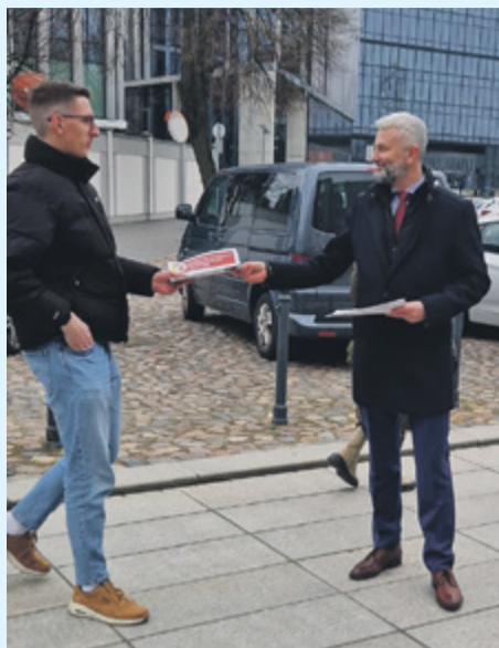
Agitacija už NS Kaune, 2024 m. balandžio 23 d.

Nacionalinio susivienijimo žygis per Lietuvą tęsiasi. Bendražygių liudijimai ir nuotraukos iš susitikimų su žmonėmis ir miestų švenčių