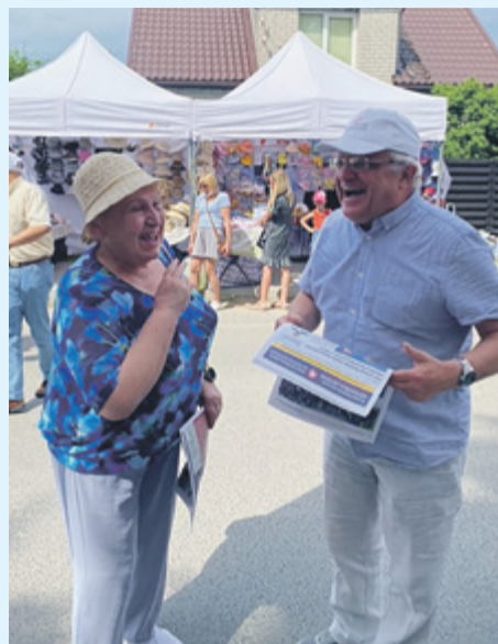
Netikėtas dėstytojo ir buvusios studentės susitikimas, Gargždai, 2024 m. birželio 1 d.