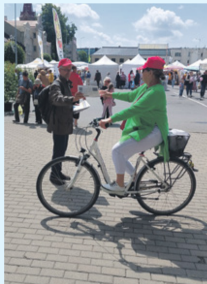
NS Kretingos šventėje, 2024 m. gegužės 11 d.

Kelionių metu vyksta širdžių meilės kaita, vienas kito pasaulių pažinimas, dalijimasis įvairiomis patirtimis. Bendrystė važiuojant, „ariant“, valgant – tai lobis!