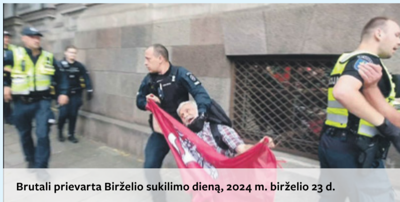
Brutali prievarta Birželio sukilimo dieną, 2024 m. birželio 23 d.