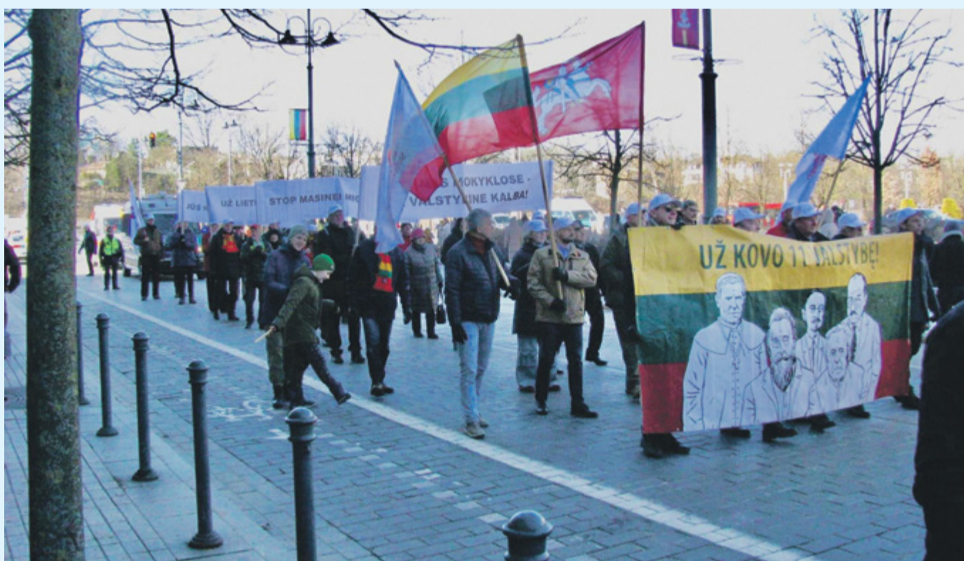
Nacionalinis susivienijimas Kovo 11-osios eitynėse, Vilnius, 2024 m. kovo 11 d